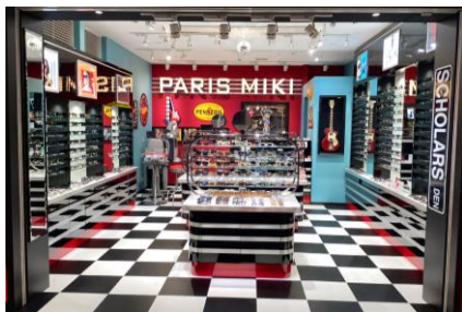
2026年3月 PARIS MIKI