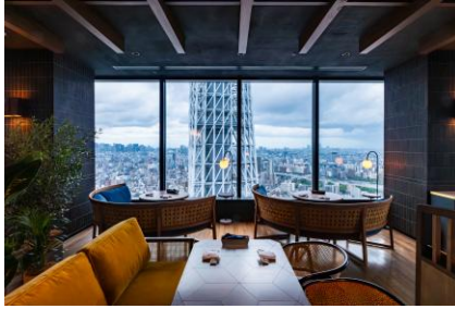
2025年7月 空色 Solairo