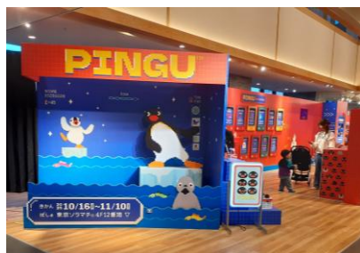
△イーストヤード4階12番地