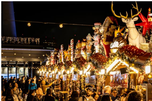
△絵本の中のクリスマスマーケット in 東京スカイツリータウン®2025