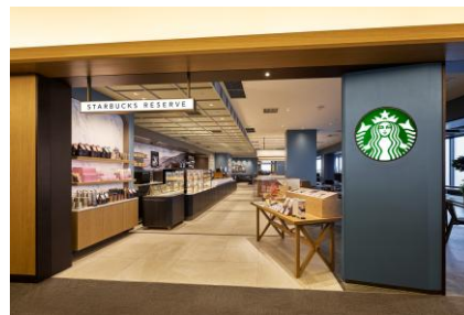
2026年3月 スターバックスリザーブ®カフェ