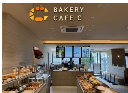
BAKERY CAFE C