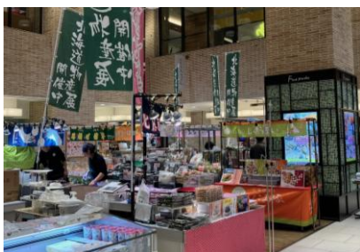
△ウエストヤード2階4番地

また、物販店舗だけではなく、ワークショップ等の体験型店舗の出店にも積極的に取り組み、買い物に加えた体験価値向上にも寄与しました。