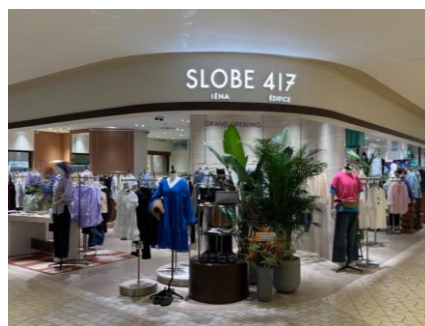
SLOBE IÉNA/417 ÉDIFICE