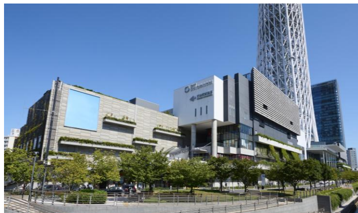
△東京ソラマチ 外観