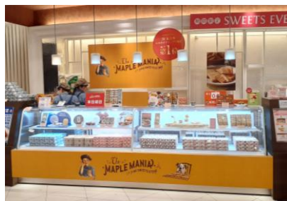
△タワーヤード2階6番地