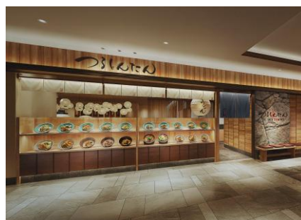
つるとんたん THE SKY TOKYO (イメージ)