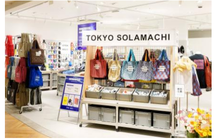
2025年10月 CITEN ユナイテッドアローズ