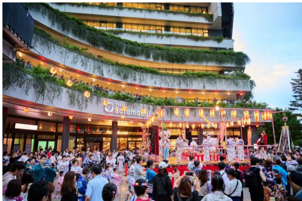
△墨田区民納涼民謡大会（2025年8月1日～3日）

特に、2025年度で3回目の開催となった「台湾祭 in 東京スカイツリータウン®2025」（2025年4月5日～6月1日）や「絵本の中のクリスマスマーケット in 東京スカイツリータウン®2025」（2025年11月6日～12月25日）は、フォトジェニックな空間とメニューの提供により、 SNS等を通じてZ世代を中心とした若年層のお客さまの来館に寄与 し、館内回遊の活性化と売上向上につながりました。