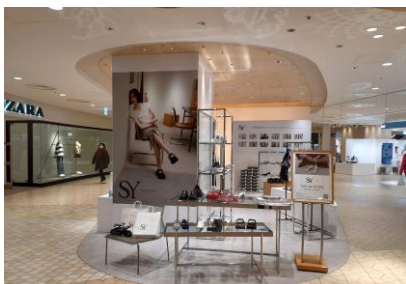
△イーストヤード2階11番地