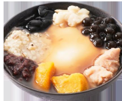
<台湾甜商店> タワーヤード 2階 綜合豆花 (ソウゴウトーファー) 850円

小豆やピーナッツ、タピオカなどたくさんの具材と自家製豆花をお楽しみいただける一品です。