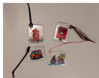
△プラ板お名前チャーム