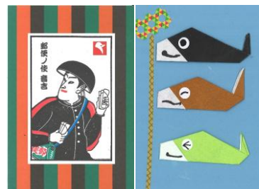
△重ね押しスタンプ △こいのぼりカード