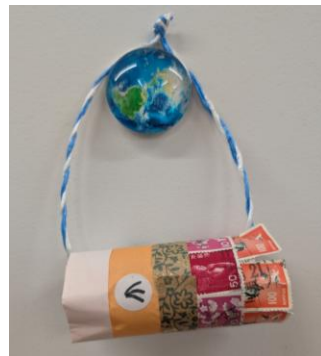
△使用済み切手を使ったこいのぼり

※このワークショップははさみを使います。小さなお子様の作業は保護者の方をお願いします。