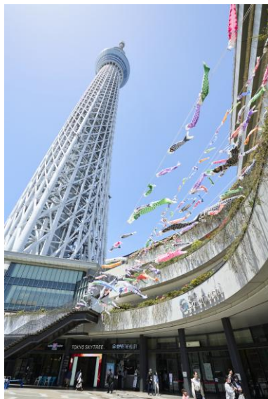
△ソラマチひろば (昨年の様子)