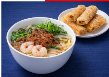
△台南セット 台南担仔麵 (タイナンタンツォーミェン) &揚げ春巻き