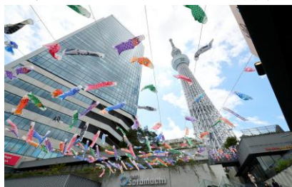
△ソラミ坂 (昨年の様子)