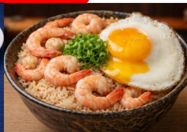
△台南蝦仁飯 (タイナンシャーレンファン)