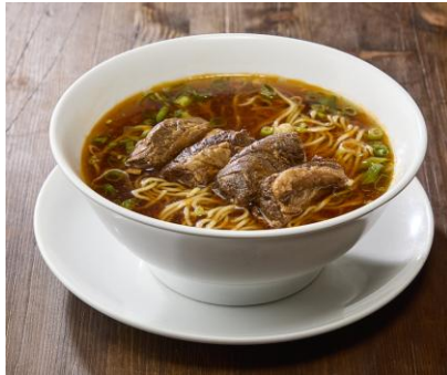
<鼎泰豊 ディンタイフォン> イーストヤード 7階 牛肉麵 (ニューローメン) 1,700円

台湾の定番スイーツ「ピーナッツ餅」を台湾カステラで再現しました。とろりと伸びる高級羽二重餅に、香ばしい特製ピーナッツ餡を合わせた贅沢な一品です。