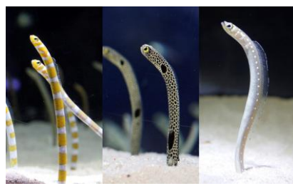
△左からニシキアナゴ、チンアナゴ、 ホワイトスポットドガーデンイール