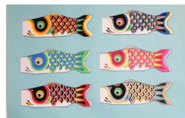
△手描きこいのぼり作品例

手描きこいのぼりを作るワークショップを実施します。 埼玉県加須市のかつての職人に教わりながら紙のこいのぼりを好きな色で染めることができる、お子さまから大人の方まで気軽に参加できるワークショップです。 作ったこいのぼりはお持ち帰りいただけます。