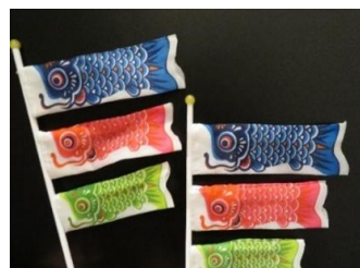
△絵手紙教室で描くこいのぼり