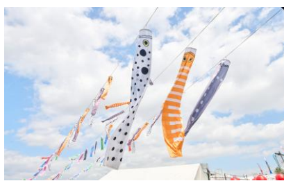
△チンアナゴのぼり、ニシキアナゴのぼり ホワイトスポットドガーデンイールのぼり (昨年の様子)