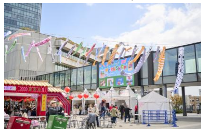
△スカイアリーナ (昨年の様子)