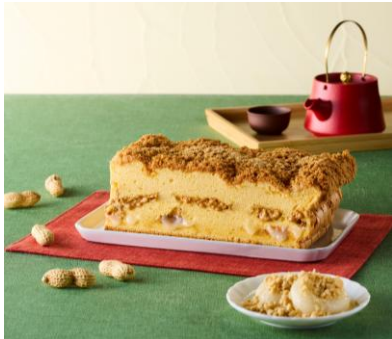
<GRAND CASTELLA> タワーヤード 2階 台湾ピーナッツ餅カステラ 2,581円

「台湾祭」だけじゃない。東京ソラマチには人気台湾グルメの店舗もたくさんございます！！