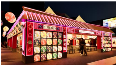
△台湾ランタンの入場ゲート