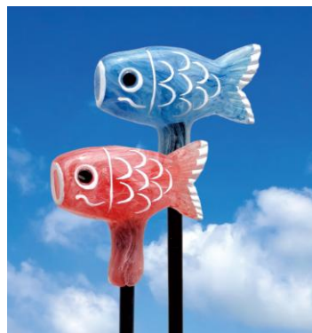
△「こいのぼりの形の飴細工」(イメージ)

期 間 2026年5月4日(月・祝)・5月5日(火・祝) 時 間 ①10:30~12:30、②13:30~16:00 場 所 イーストヤード2階 特設会場 料 金 2,480円 受 付 当日受付(店頭) 対象年齢 4歳以上